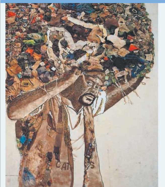
NO CAMINHO DA SUSTENTABILIDADE RELATÓRIO DE SUSTENTABILIDADE COCA-COLA BRASIL 2009

>> VIK MUNIZ – O artista assina a capa do Relatório de Sustentabilidade 2009 da Coca-Cola. A série Retratos do Lixo foi produzida com resíduos recolhidos pelos catadores de Jardim Gramacho.